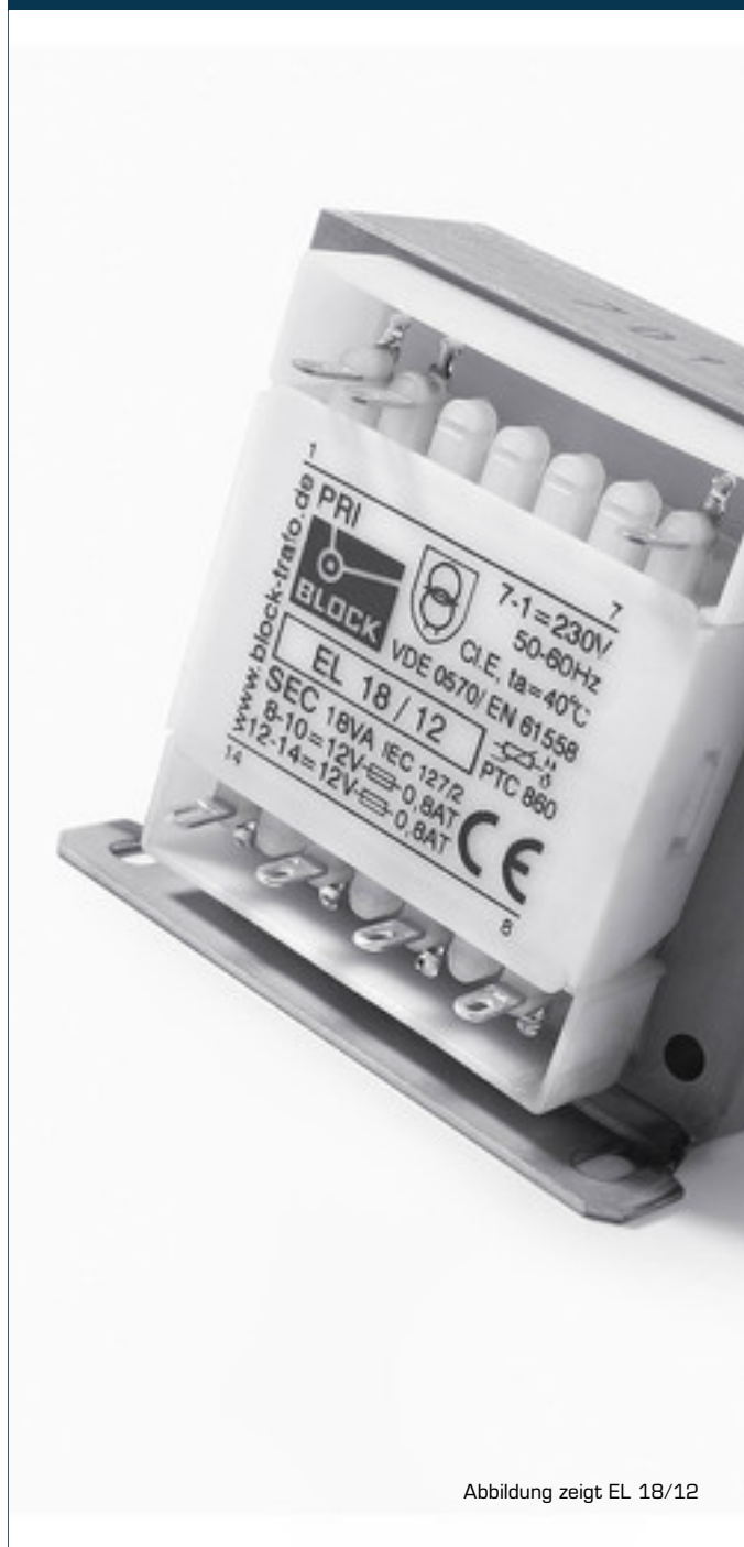
Abbildung zeigt EL 18/12