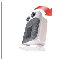
Kipp-Schutz/Auto off = Sicherheitsabschaltung