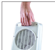
Praktischer Tragegriff im Gehäuse