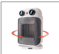
70° oszillierend zur besseren Luftverteilung